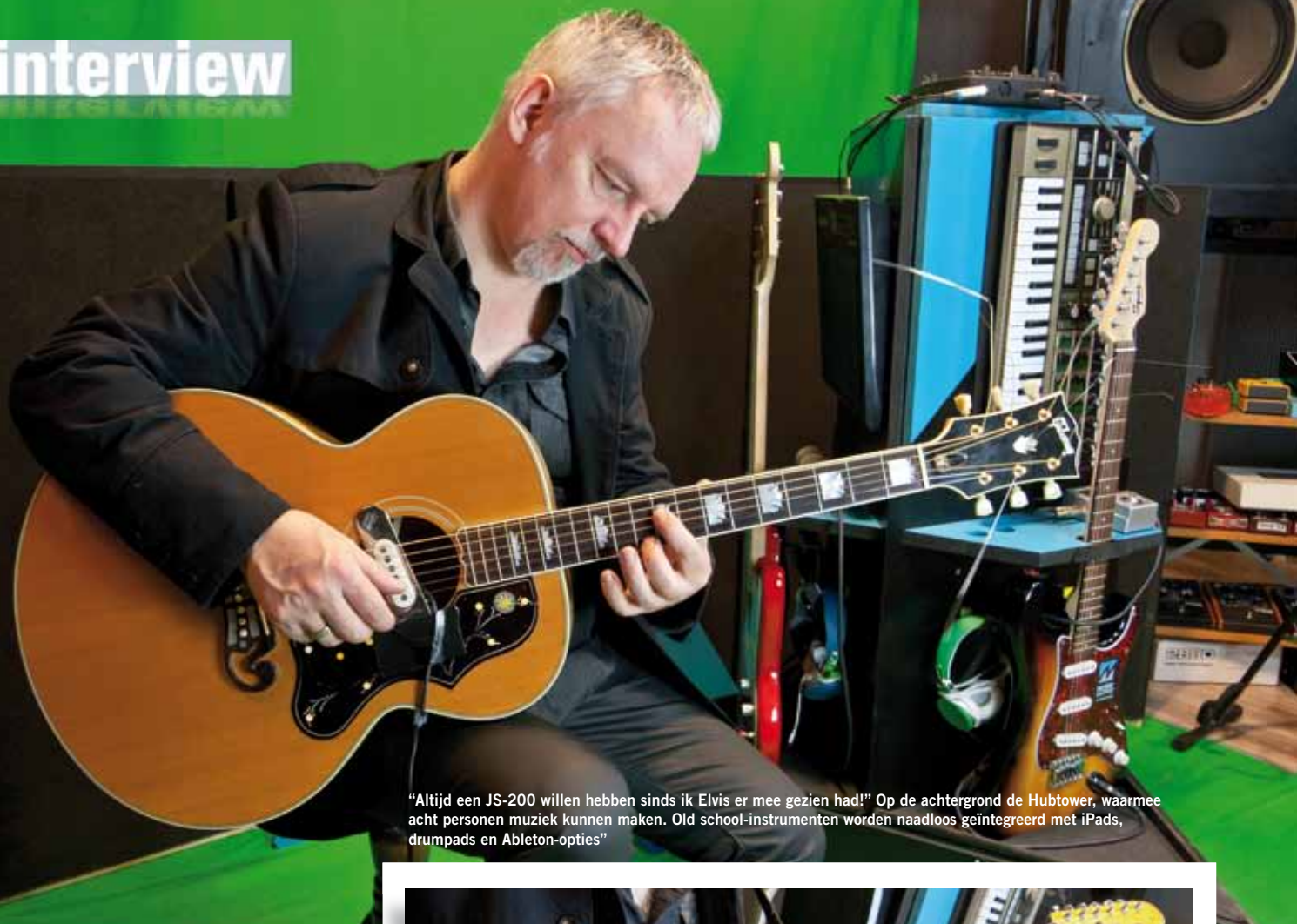
"Altijd een JS-200 willen hebben sinds ik Elvis er mee gezien had!" Op de achtergrond de Hubtower, waarmee acht personen muziek kunnen maken. Old school-instrumenten worden naadloos geïntegreerd met iPads, drum pads en Ableton-opties"

>> van zelf verzinnen en dingen naspelen. Ik heb een aantal leerlingen die heel goed anderen kunnen naspelen en als ze dan zelf iets moeten maken is het kwaliteitsverschil te groot. De sportwagen staat klaar en voor hun gevoel moeten ze met de bus. Daarom is het belangrijk dat je met 7 of 8 jaar al begint met zelf iets te maken, al is het maar een eigen tekst, of een eigen ritme. Zelfs als je alleen maar in een coverband wilt spelen, geeft het kunnen maken van iets eigens je meerwaarde als muzikant. Een ideale balans? Dat vind ik zelf nog lastig; daar kun je een leven lang mee worstelen.