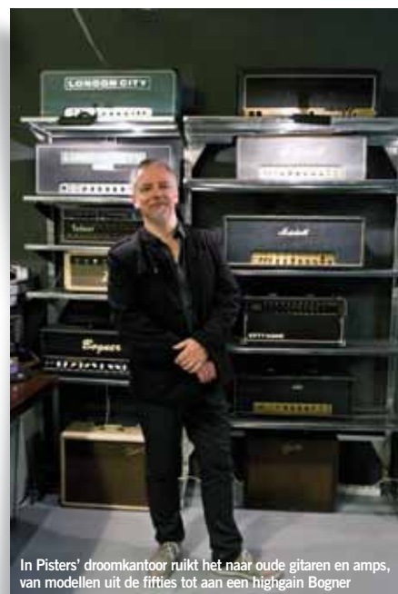
In Pisters' droomkantoor ruikt het naar oude gitaren en amps, van modellen uit de fifties tot aan een highgain Bogner

"Een goed geluid is niet makkelijker geworden, juist omdat je zoveel keuzes hebt. Verder is ritme voor de meeste studenten een onontwikkeld gebied."