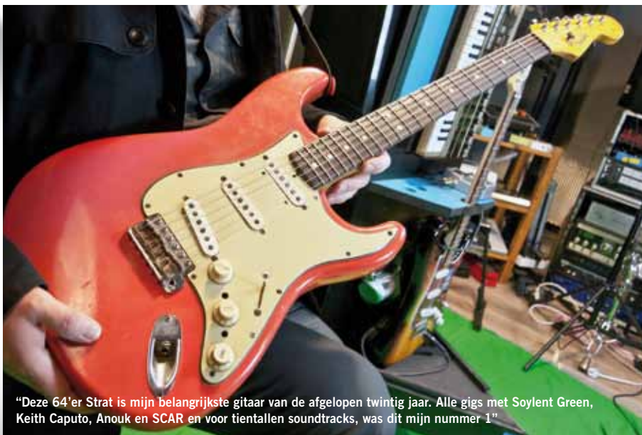
"Deze 64'er Strat is mijn belangrijkste gitaar van de afgelopen twintig jaar. Alle gigs met Soy lent Green, Keith Caputo, Anouk en SCAR en voor tientallen soundtracks, was dit mijn nummer 1"